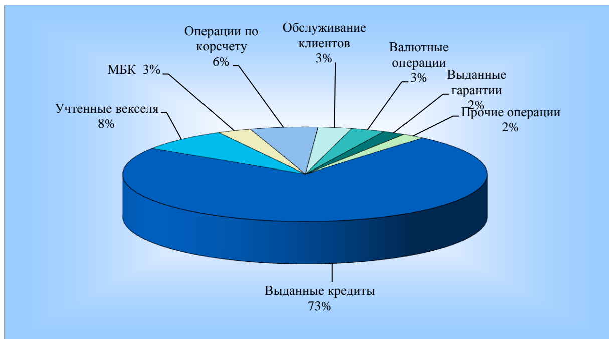
Рис. 1. Структура доходов ООО «XXX» в 2017 г.