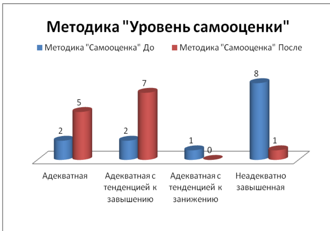
Рис. 12 Сравнение уровня самооценки по количеству человек